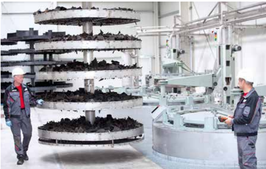
Einblick in die Produktion von recyceltem Industrieruß. Das Material aus Altreifen kommt grob geschreddert in der Produktion an und durchläuft dann den Pyrolyse-Prozess

Die Anforderungen an die Materialeigenschaften steigen stetig, gleichzeitig sollen hochleistungsfähige Materialien und Zusatzstoffe möglichst nachhaltig sein. Dafür sind Alternativprodukte und Rohstoffe gefragt, die den CO 2 -Fußabdruck der Endprodukte verringern. Das Kunststoffadditiv Industrieruß kann nun in einem neuartigen Wiederaufbereitungsprozess aus Altreifen gewonnen werden.